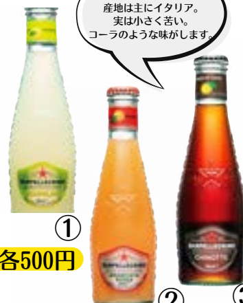
① ② ③ 大人のスパークリングジュース

キノットは柑橘類の一種。 産地は主にイタリア。 実は小さく苦い。 コーラのような味がします。